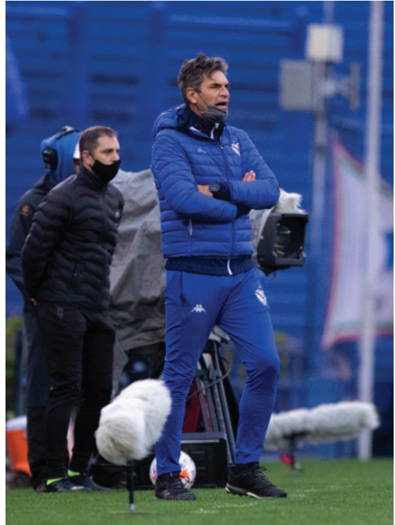
Dirigiendo en partido vs Godoy Cruz por el Torneo LPF 2021