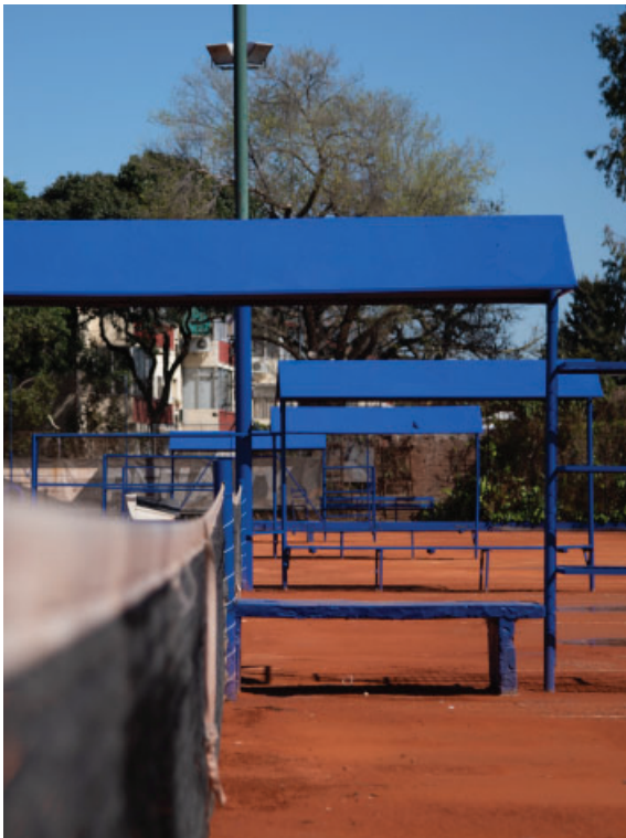
Reacondicionamiento de canchas de Tenis en Polideportivo