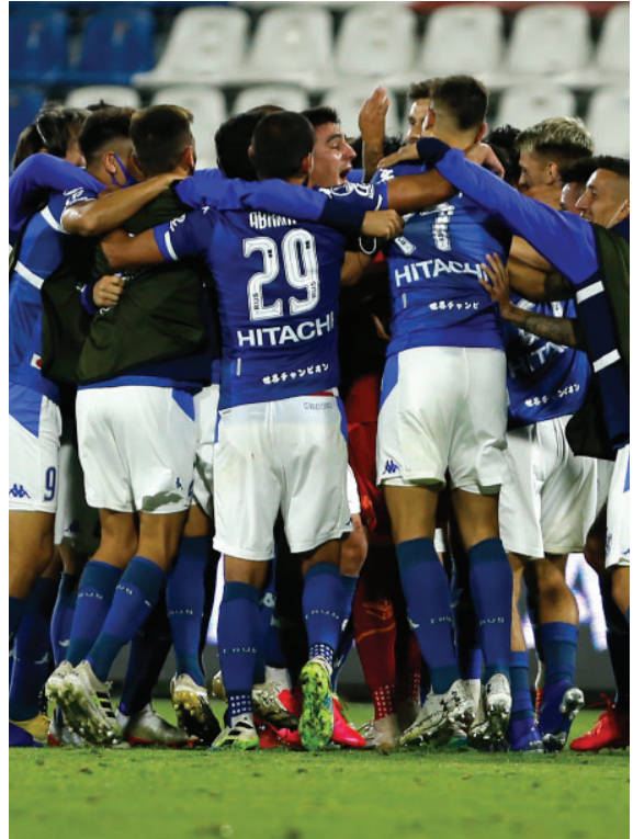
Festejo de gol en Chile, vs U. Católica por la Sudamericana 2020.