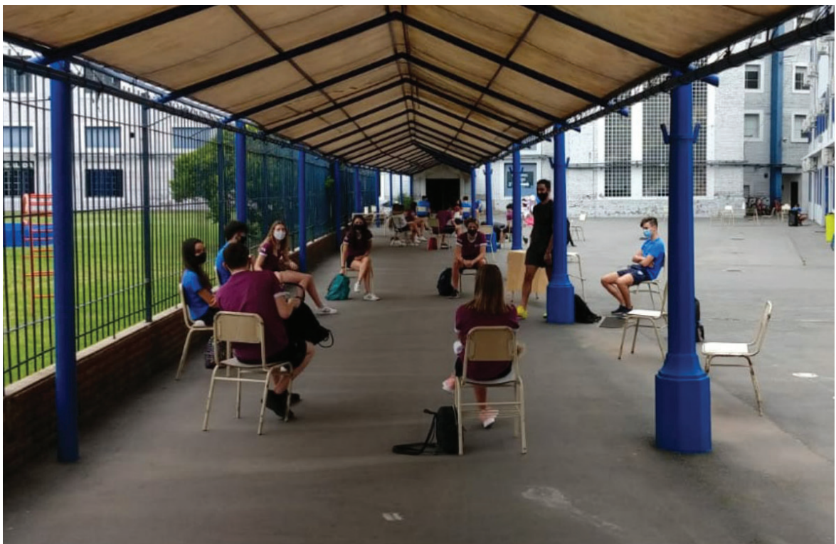
El dictado de clases presenciales en unas de las primeras aperturas, luego de una cuarentena estricta.