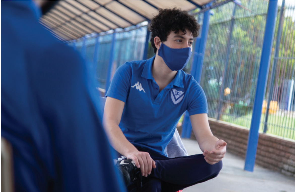
Clases escolares al aire libre del Insitituto Dr. Dalmacio Vélez Sarsfield en época de pandemia

Ejercicio N° 111 - Del 1 de julio de 2020 al 30 de junio de 2021