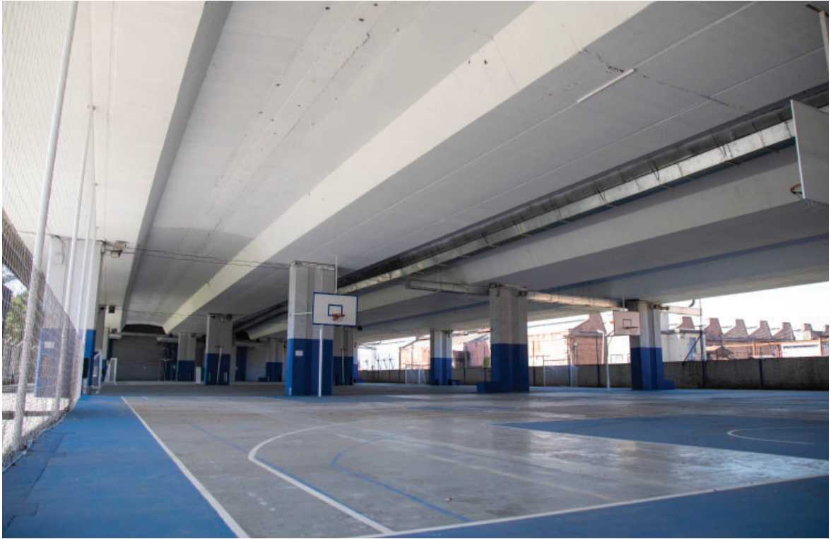
Obras en canchas multifunción del Polideportivo