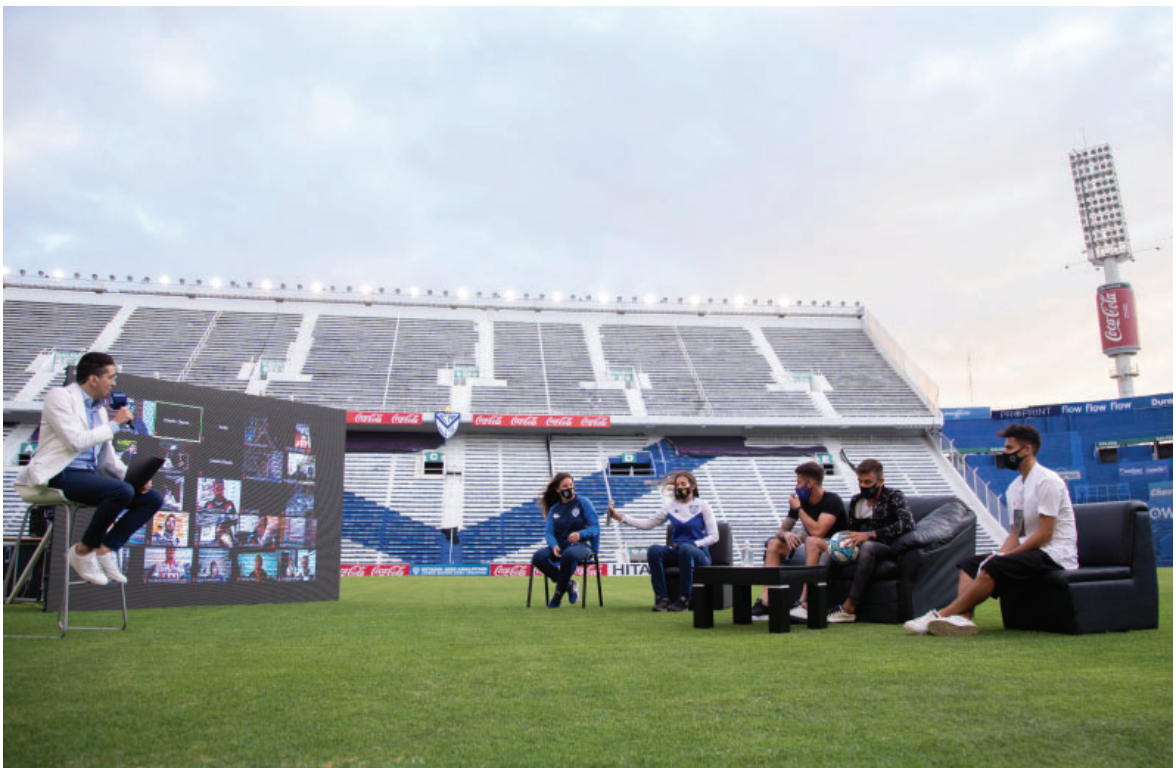
Evento Peñas al aire libre en el estadio José Amalfitani.