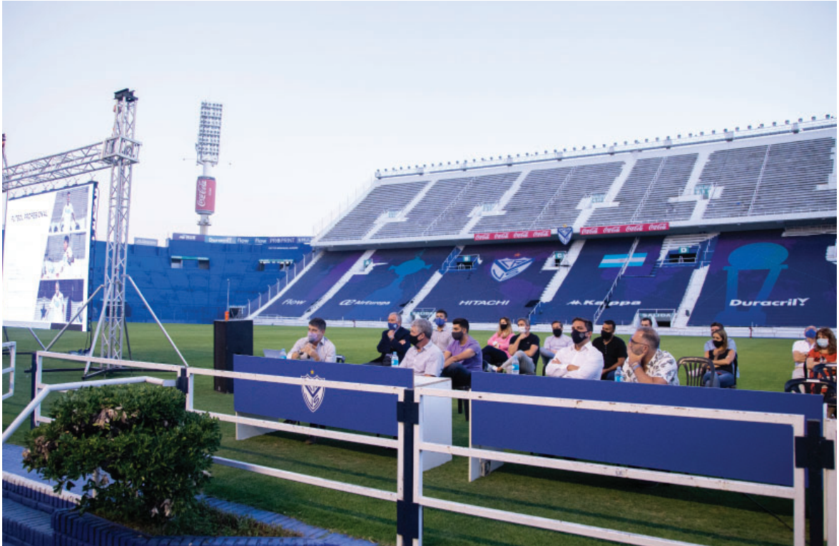
Asamblea informativa al aire libre en el estadio José Amalfitani.