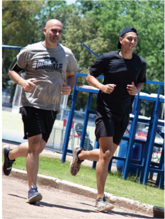
Actividad deportiva en pista de atletismo en Polideportivo