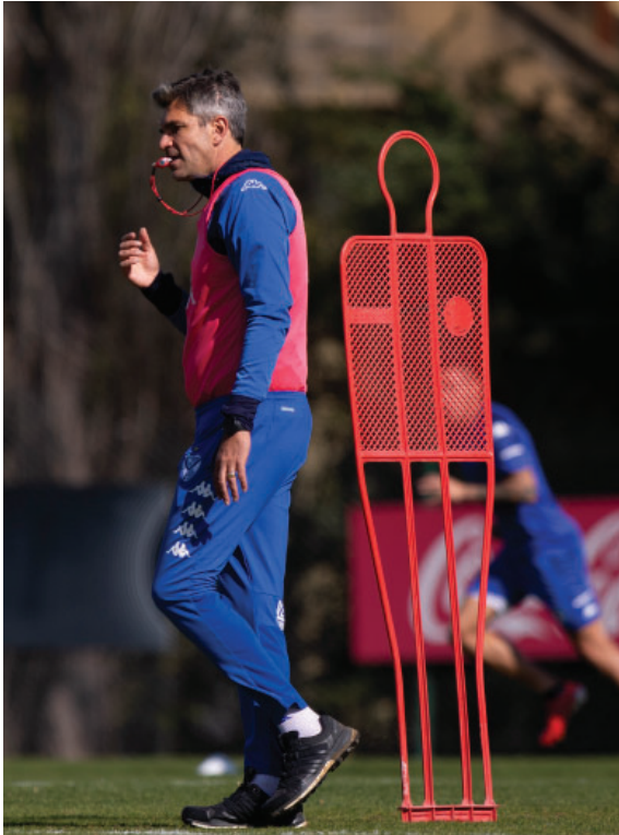
Práctica matutina en la Villa Olímpica.