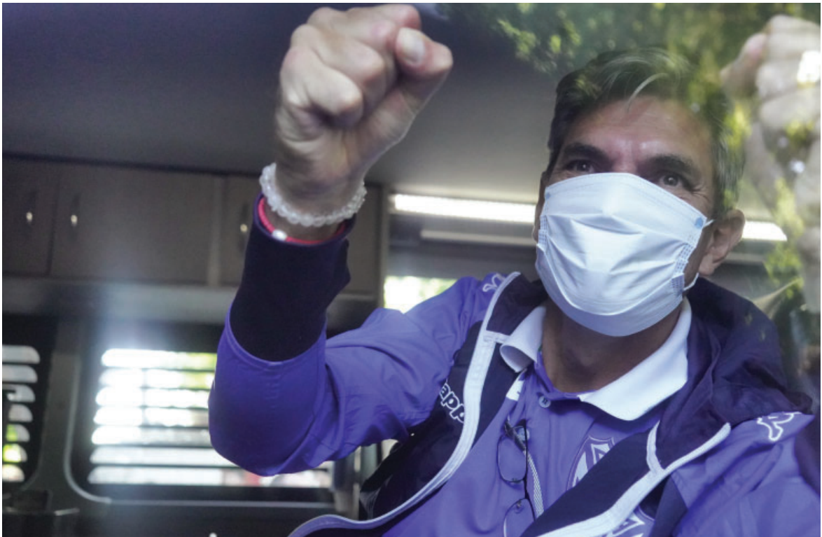
Mauricio Pellegrino. Director Técnico del plantel profesional de fútbol de Primera División.