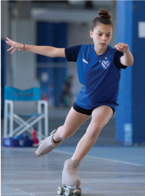
Patinaje Artístico en pista del Polideportivo

Ejercicio N° 111 - Del 1 de julio de 2020 al 30 de junio de 2021