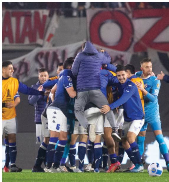
Histórica postal en el Monumental, tras eliminar a River en el máximo certamen continental.2021