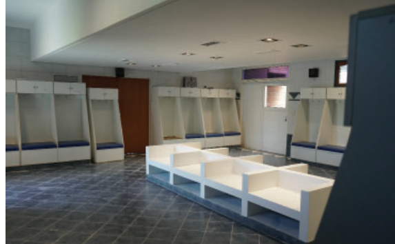
Reacondicionamiento y remodelación del vestuario de Fútbol Profesional en Villa Olímpica.