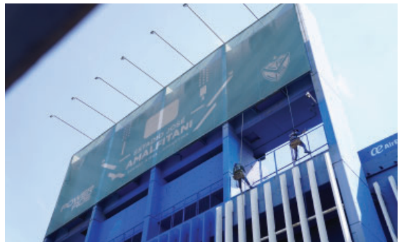
Puesta en valor: pintura integral del Estadio.