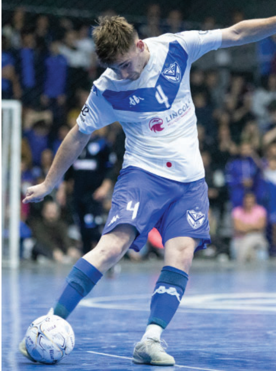
La primera de Futsal en búsqueda del ascenso.