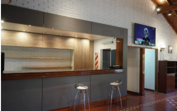
Reacondicionamiento y remodelación del comedor de Fútbol Profesional en Villa Olímpica.