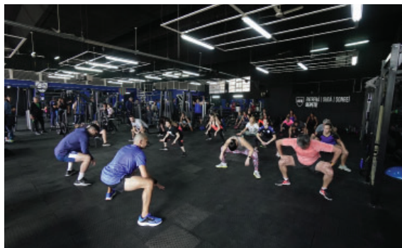
Dotación y renovación integral de equipamiento y superficie para el Gimnasio de musculación del Polideportivo.