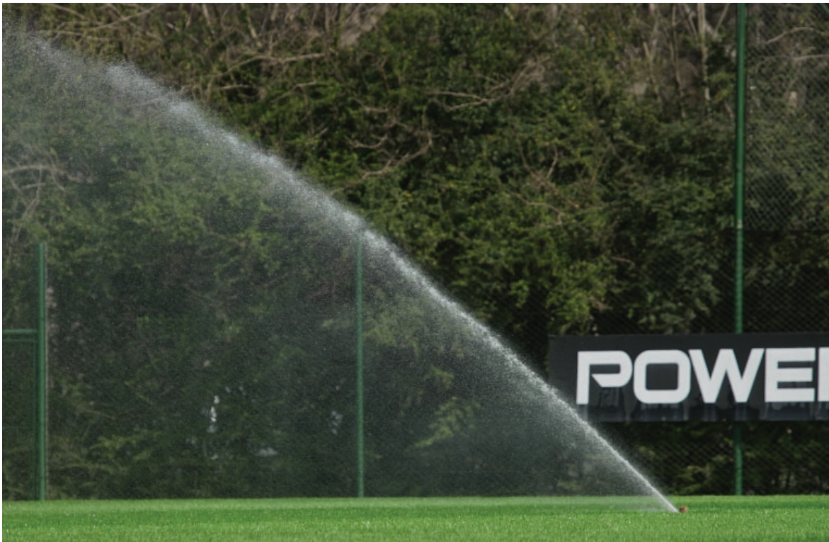
Riego con aspersores en la Villa Olímpica.