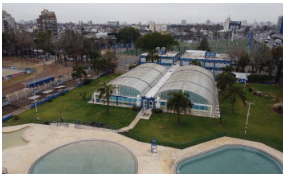
Nuevo sistema de calefacción y calderas en el Complejo Acuático.