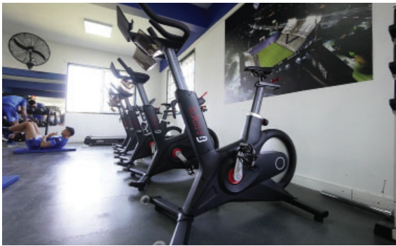
Equipamientos nuevos para vestuarios en Villa Olímpica.