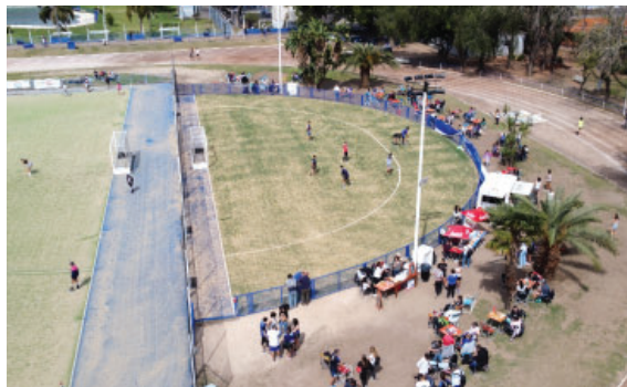
Obra punta hockey en sector Polideportivo.