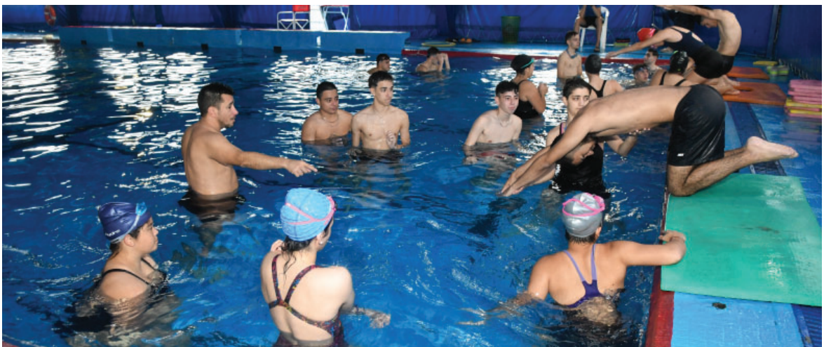
Clases de Profesorado de Educación Física en Pileta del Instituto.