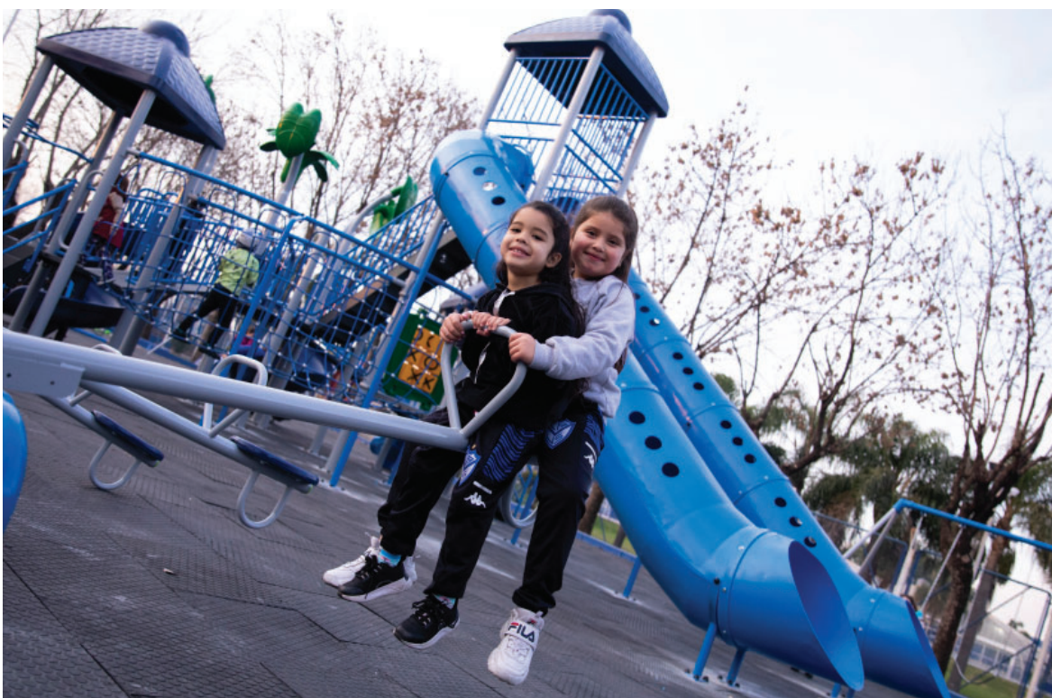
Nueva Plaza Don Pepe en el Polideportivo.