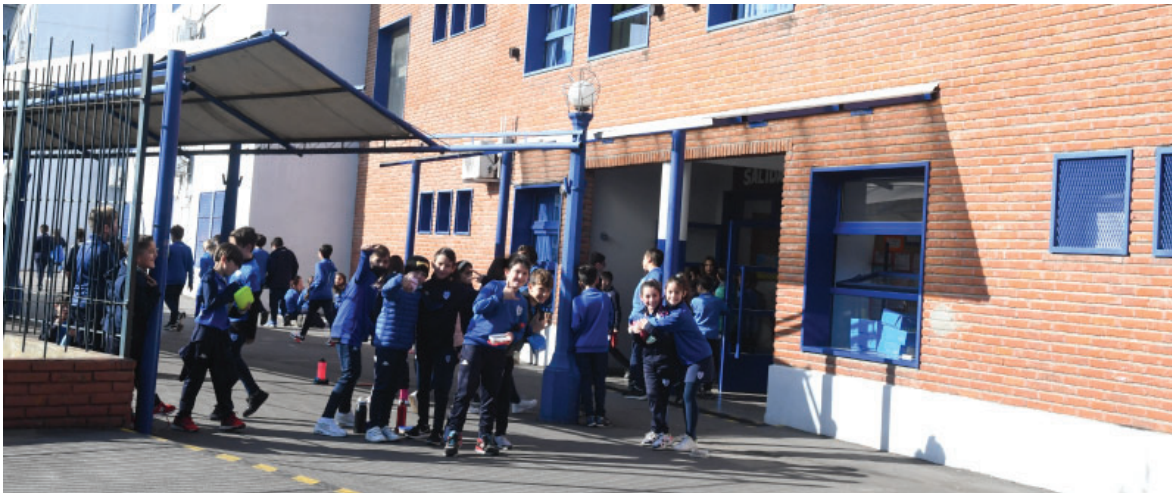
Recreación en el Dr. Dalmacio Vélez Sarsfield.