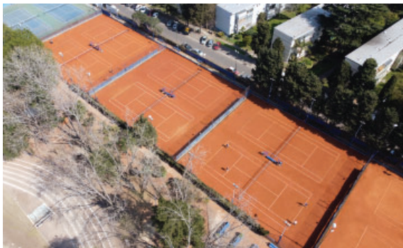
Puesta en valor de las canchas de Tenis del Polideportivo.

Ejercicio N° 112 - Del 1 de julio de 2021 al 30 de junio de 2022