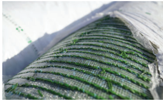
Césped híbrido para el Estadio José Amalfitani.