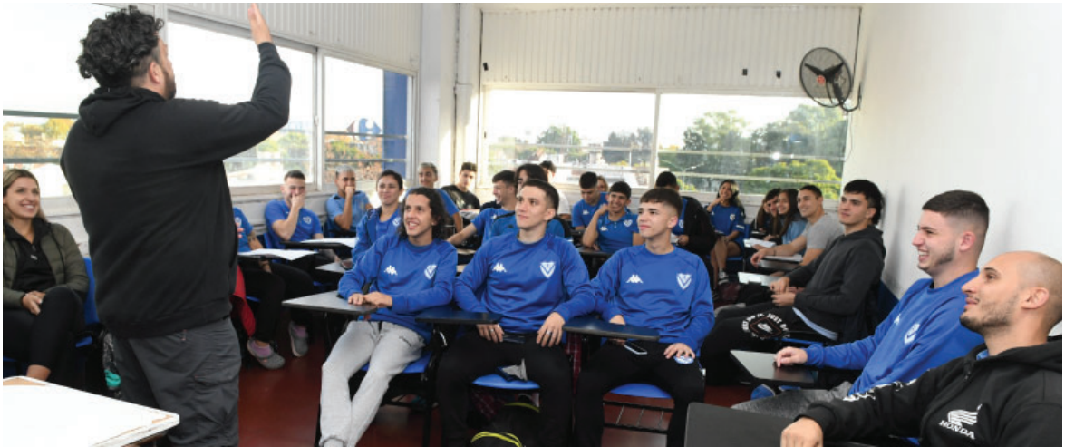
Clases de Profesorado de Educación Física.

Ejercicio N° 112 - Del 1 de julio de 2021 al 30 de junio de 2022