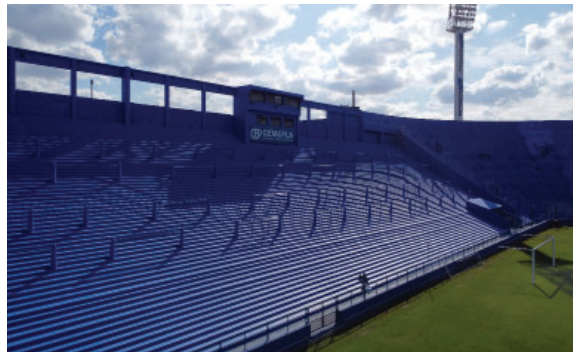
Reacondicionamiento de pintura en la Popular Oeste.