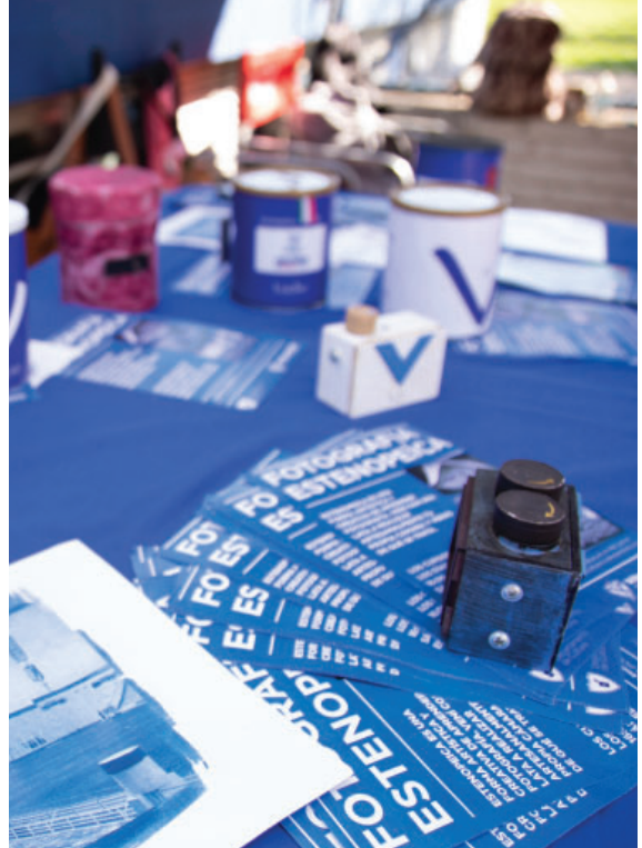
Muestra de la actividad de Fotografía Estenoica.