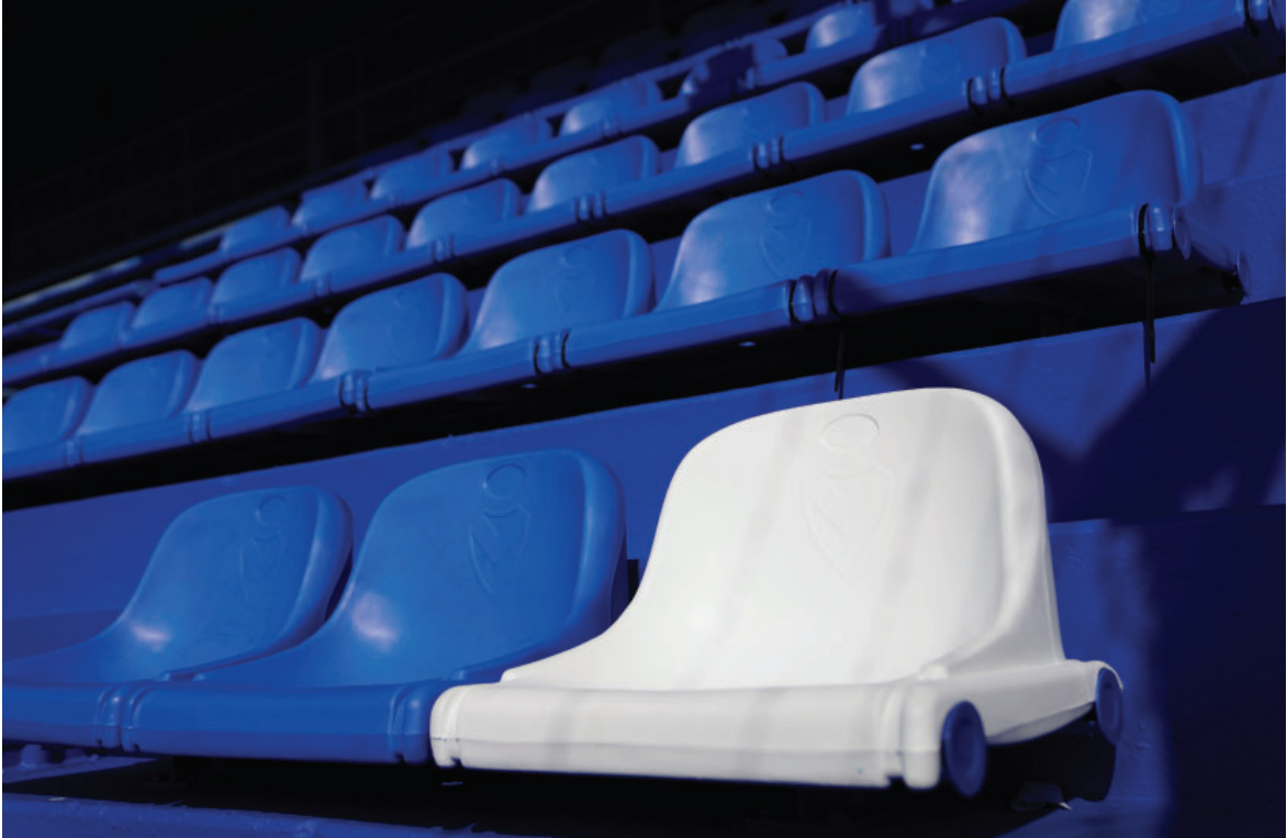
Masterplan: cambios de butacas en el Estadio.

Ejercicio N° 112 - Del 1 de julio de 2021 al 30 de junio de 2022