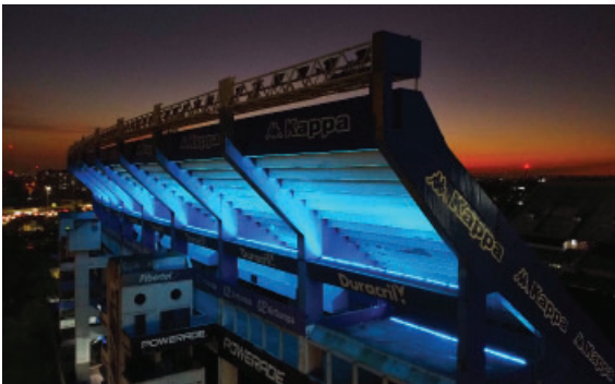
Masterplan: Luces LED en el friso SUR con vista autopista.