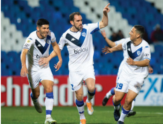
Diego Godín celebra su primer gol con la camiseta de Vélez.